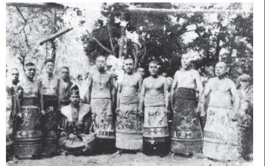
↑9月卯の日に行われていた高木神社の相撲(昭和2年)