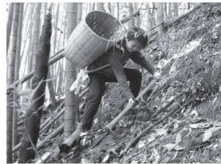
↑急な斜面に生えたたけのこも、上手に掘り起こせました

4月25日、樹田にぎわいづくり実行委員会が主催して「樹田名産たけのこで楽しもう体験イベント」が開催され、4家族9人が参加しました。たけのこを掘る・皮をむく・ゆでる・食べるまでがセットになった体験型イベントで、参加した児童たちはくわを上手に使い50キロほどのたけのこを収穫し、美味しく食べていました。