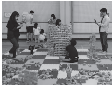
↑女の子が入る脱出不可能な円柱もカプラを使用しています

英彦山スロープカー花駅2階で5月16日から2日間、木のおもちゃキャラバンが開催され、約200人が訪れました。たくさんの木のおもちゃの中で人気だったのが、厚さ・幅・長さの比率が1:3:15で同じサイズに作られたカプラという積み木を高く積み上げ一斉に倒す「ナイアガラの滝」で、多くの児童が挑戦していました。