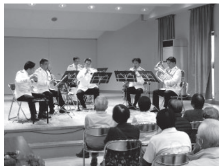
↑ニセ電話詐欺対策を学んだあと音楽を楽しみました

シニアパワーアップ塾の総会がオークホールで4月22日に開かれました。総会后、田川警察署による特殊詐欺防犯の研修が行われ、演劇を通して事例の紹介があり、身近な問題として理解が深まりました。最後は警察音楽隊によるミニコンサートも開催。懐かしい楽曲が生演奏で披露され、楽しいひとときを過ごしました。