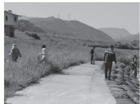
↑清掃中の様子。ごみのポイ捨てはやめましょう

春の遠賀川一斉清掃期間の5月17日、歓遊舎ひこさん前の彦山川河川敷で、清掃ボランティアが行われました。地元の野田行政区の皆さんをはじめ、添田町婦人会、添田町社会福祉協議会、アカザを守る会、ヤマト運輸、町職員のボランティア約60人が河川敷などに捨てられたごみなどを約1時間にわたり拾い集めました。