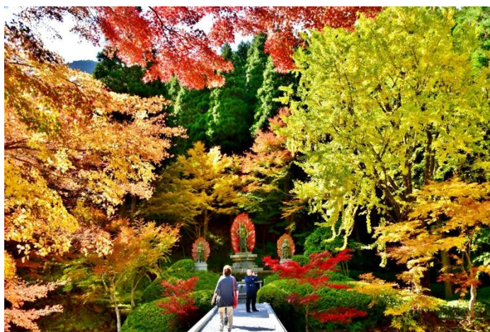
毎年多くの観光客でにぎわう紅葉