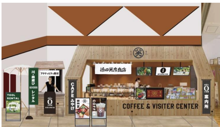
ビジターセンター完成イメージ

カフェを運営したり、イベントを企画したり、SNS で魅力を発信したり。添田町を訪れた誰かが「また来たいな」と思えるような体験や空気感を、一緒につくってくれる方をお待ちしています。