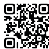
コワーキングスペースサイト