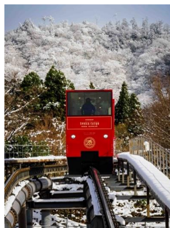
英彦山神宮までのスロープカー