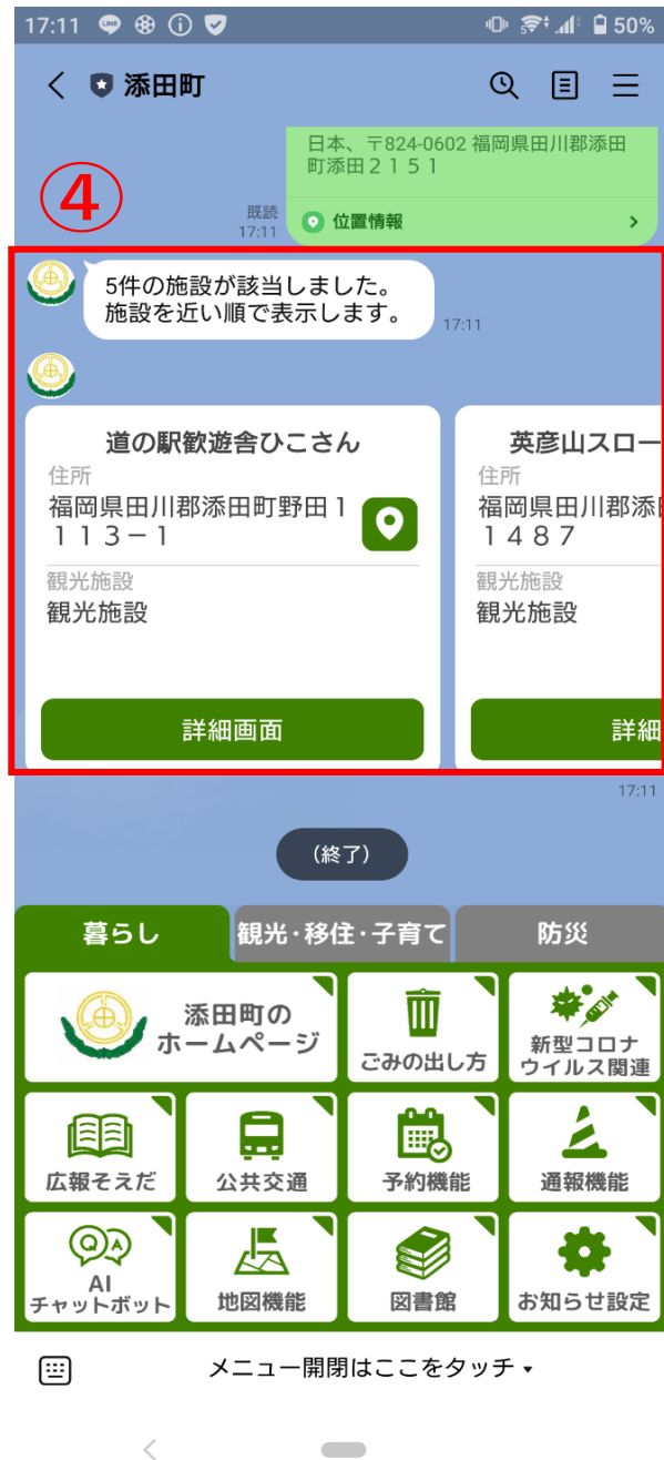
④該当施設等の情報が近い順に表示されます