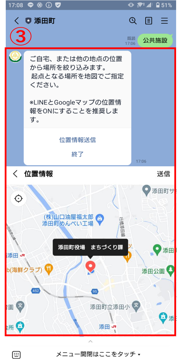
③起点となる位置情報を送信