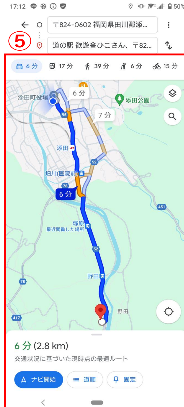
⑤ナビ機能としても活用できます