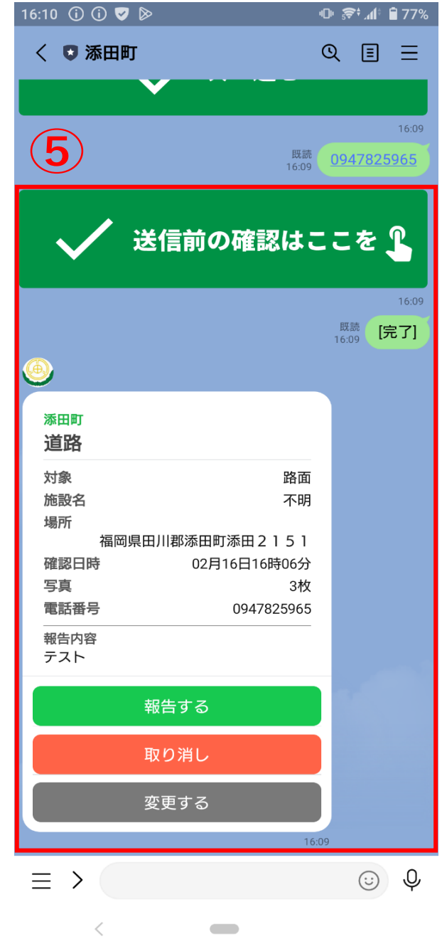
⑤送信前の内容確認画面