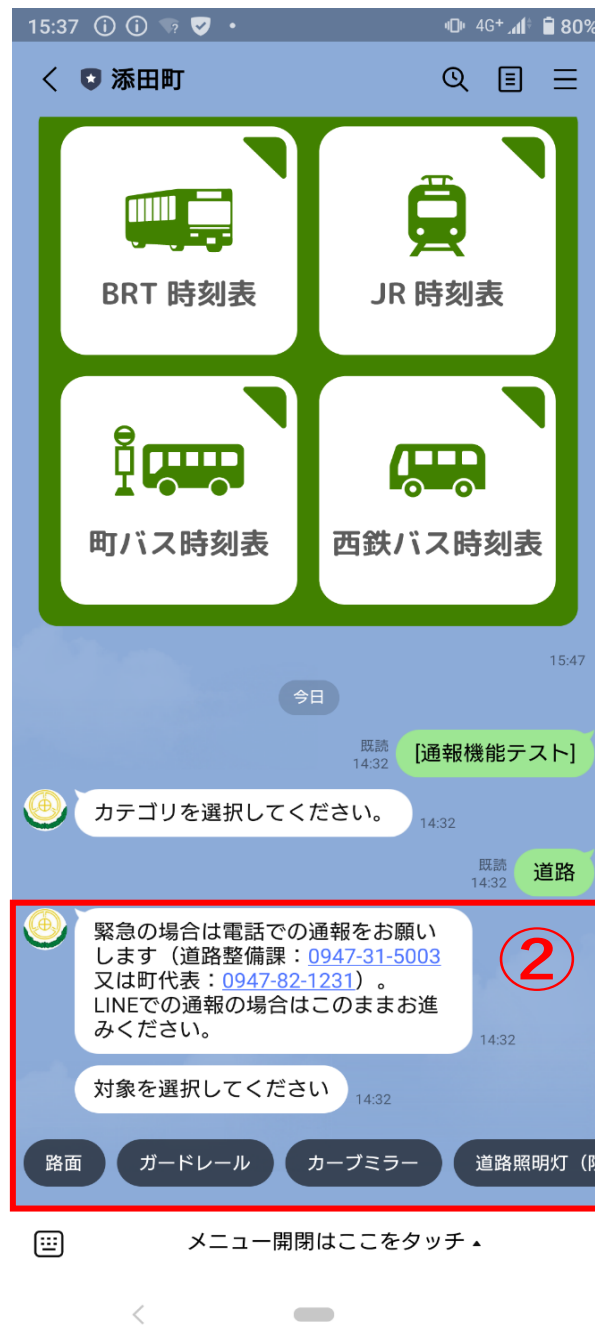
② 「対象」 を選択