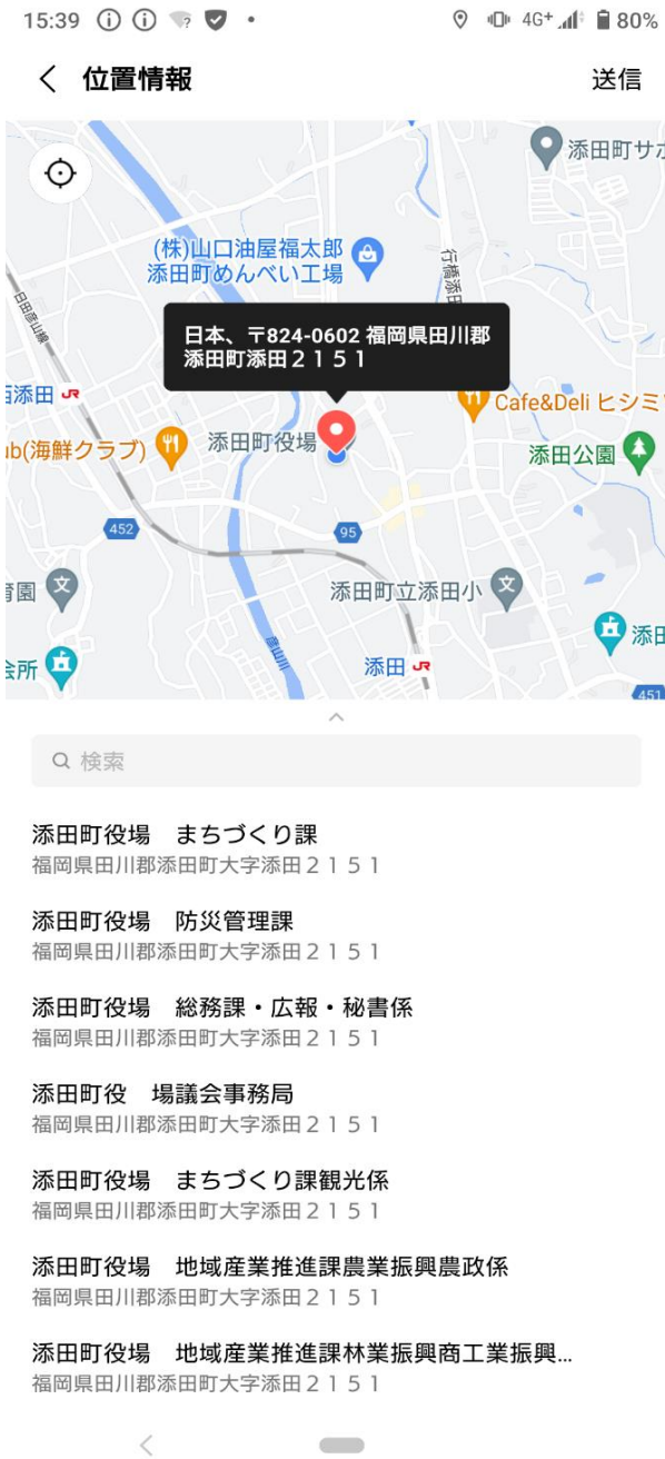
「位置情報」の送信イメージ