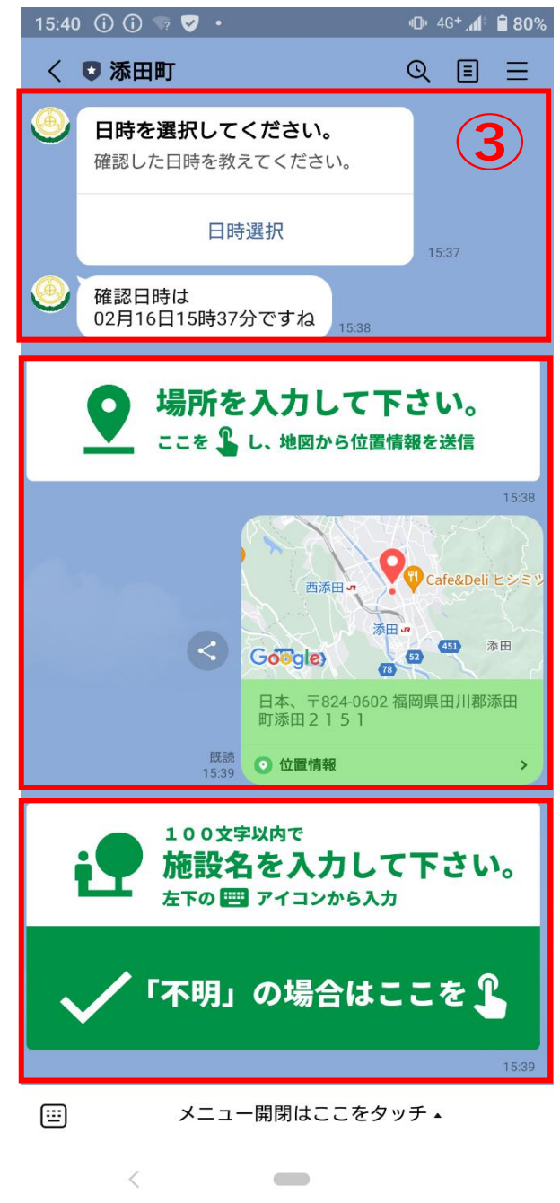
③ 「日時」 「場所」 「施設名」 を選択