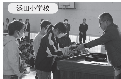
←校長先生が代表児童に贈呈しました

1月9日各小学校で、始業式終了後に全校生徒の前で「大谷グローブ」が校長先生からお披露目されました。届けられた3個にも意味があるそうです。1つは右利き高学年用、もう1つは右利き低学年用、3つめは左利き用。この3つを加えてみんなで野球をしてほしいといったコンセプトになっています。添田町から世界へ羽ばたく野球選手が出ると嬉しいですね。