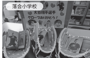
↑みんなで記念撮影しました ←パネルを作成し校内に飾っています