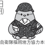
自衛隊福岡地方協力本部飯塚地域事務所

●自衛官候補生 ●試験日 ▽筆記試験・適性検査／1月14日(火)～2月12日(水)のうちいずれか1日 ▽口述試験・身体検査／2月20日(木)～23日(日)のうちいずれか1日 ●受験資格 日本国籍を有する18歳～32歳の人 ●受付締切 ▽高校新卒者／2月4日(火) ▽その他の人／2月10日(月) ※飯塚地域事務所では、随時説明会を開催しています。ご都合に合わせて個別説明、出張説明も可能です。詳しくは問い合わせください。 自衛隊福岡地方協力本部飯塚地域事務所 ☎0948-22-4847