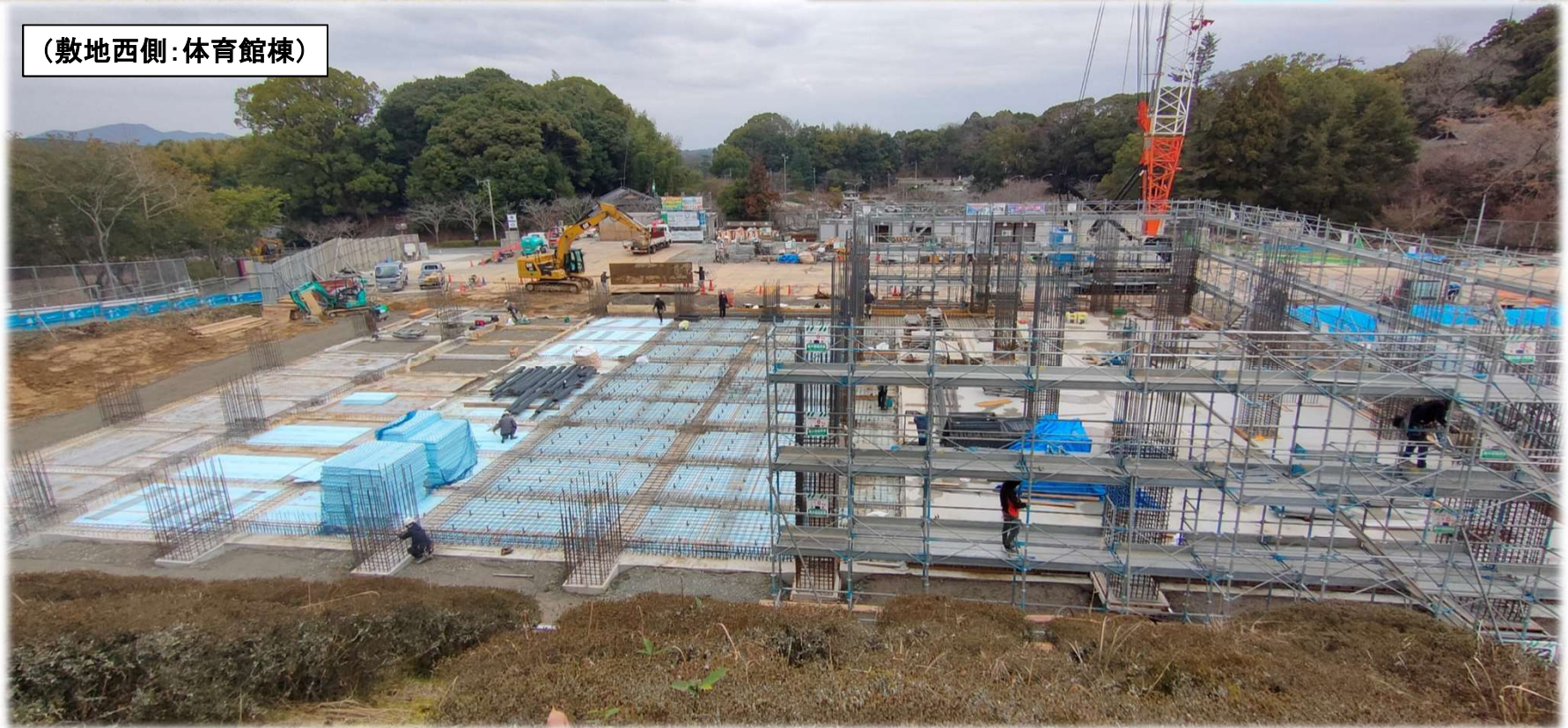
(敷地西側:体育館棟)