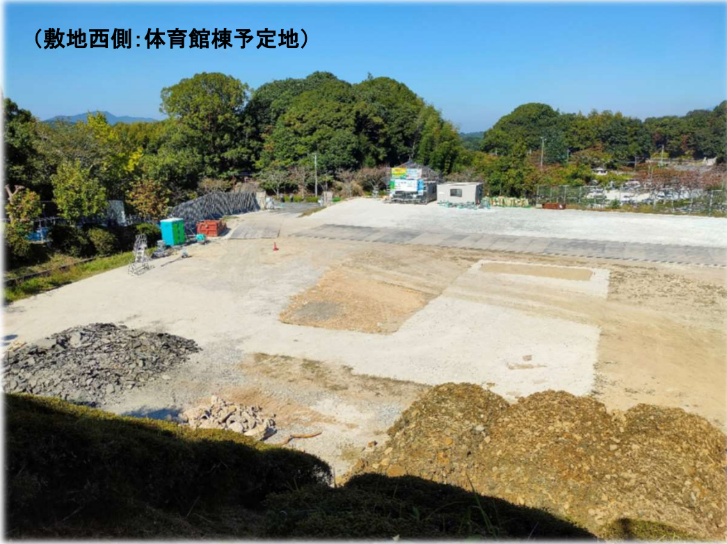
(敷地西側:体育館棟予定地)