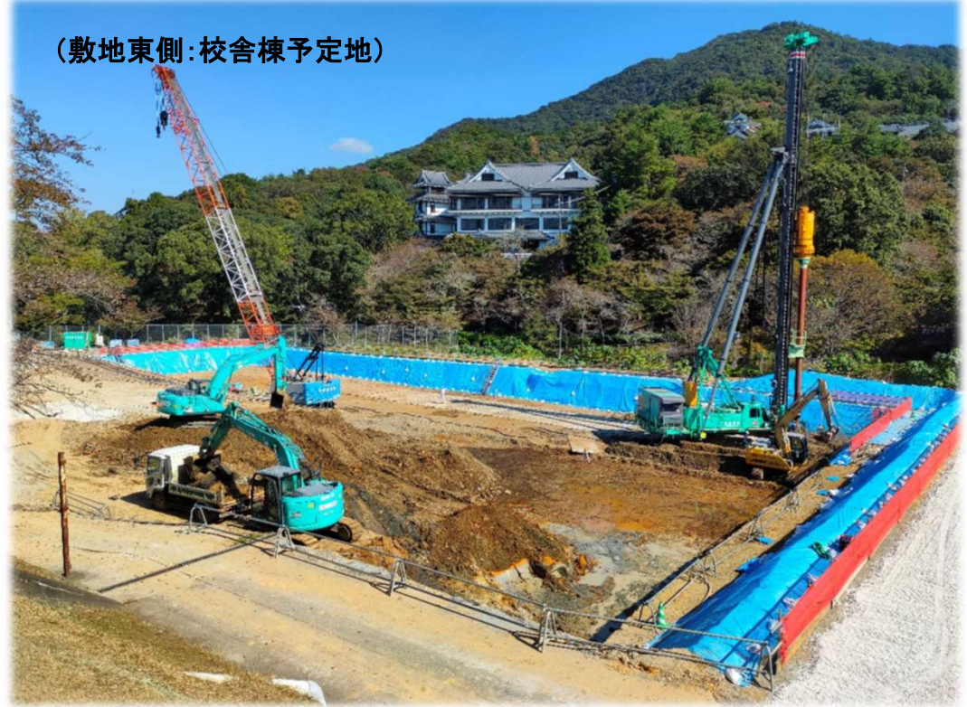
(敷地東側:校舎棟予定地)