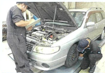
自動車整備科(自動車定期点検)