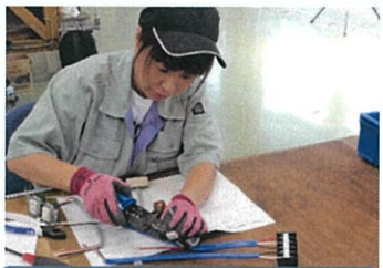
電気工事科(電気配線工事)