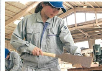
木工家具科(かんな削り・のこ引き)