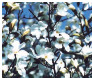
「タムシバ」 3〜4月上旬、岩石山に春を告げる花。コブシによく似ています