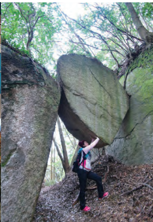
岩の間にはまる巨大なチョッキストーン！ 付録MAP A