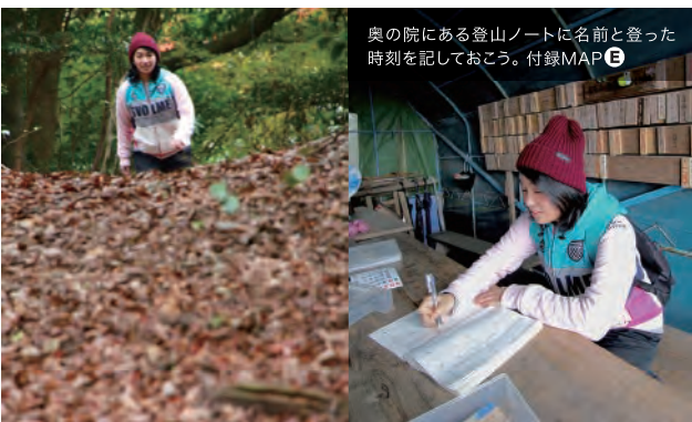
奥の院にある登山ノートに名前と登った時刻を記しておこう。付録MAP E