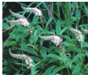
「オカトラノオ」 6〜7月、奥の院に咲く、尾のようにしなやかにカーブした花穂が特徴