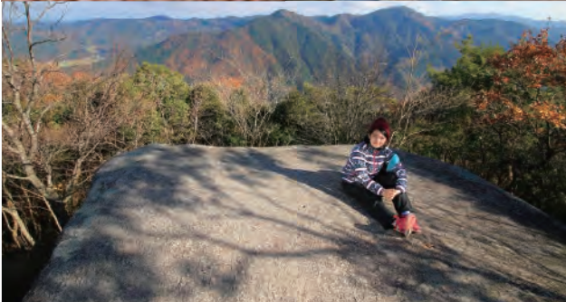
リビングほどの広さがある八畳岩。ランチはここがいいね！ 付録MAP B