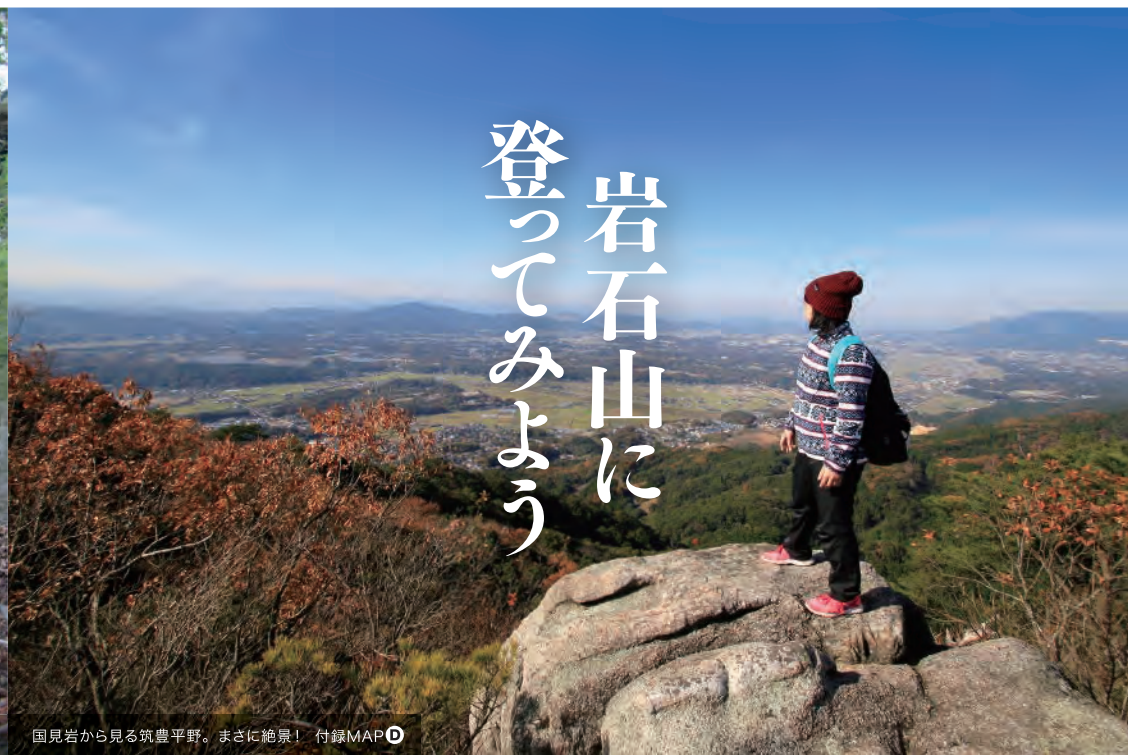
国見岩から見る筑豊平野。まさに絶景！ 付録MAP D